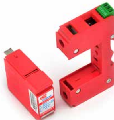
VCL Slim Plugável Consulte outros modelos no site

O VCL SP (Slim Plugável) é um DPS monopolar utilizado na proteção de aparelhos eletroeletrônicos conectados à rede elétrica. No final da vida útil do dispositivo, somente a parte móvel (plugue) é substituída, ou seja, não é preciso desfazer as conexões da parte fixa (base) com as linhas. Essa instalação, sem interrupção da energia, reduz o custo e o tempo de manutenção, além de proporcionar mais segurança ao profissional.